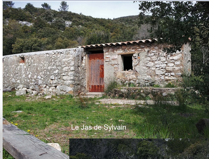
Le Jas de Sylvain

Ce parcours n'est pas entièrement balisé et un GPS est fortement recommandé.